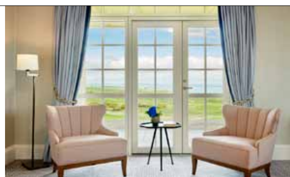
Pokoj s výhledem