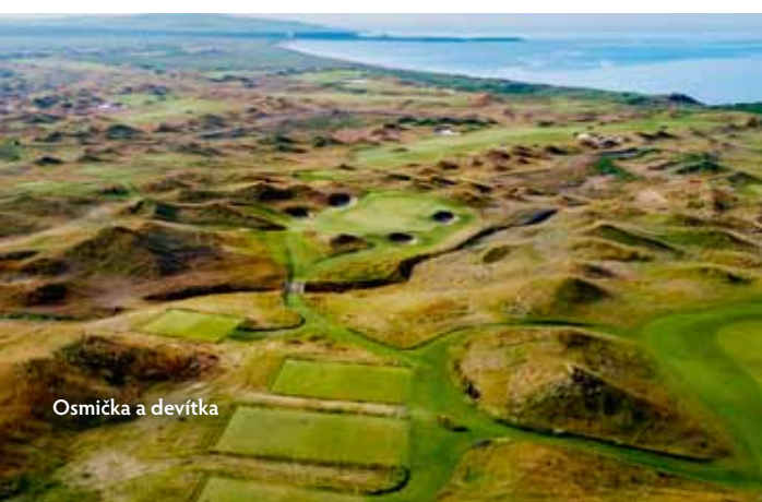
Osmička a devítka