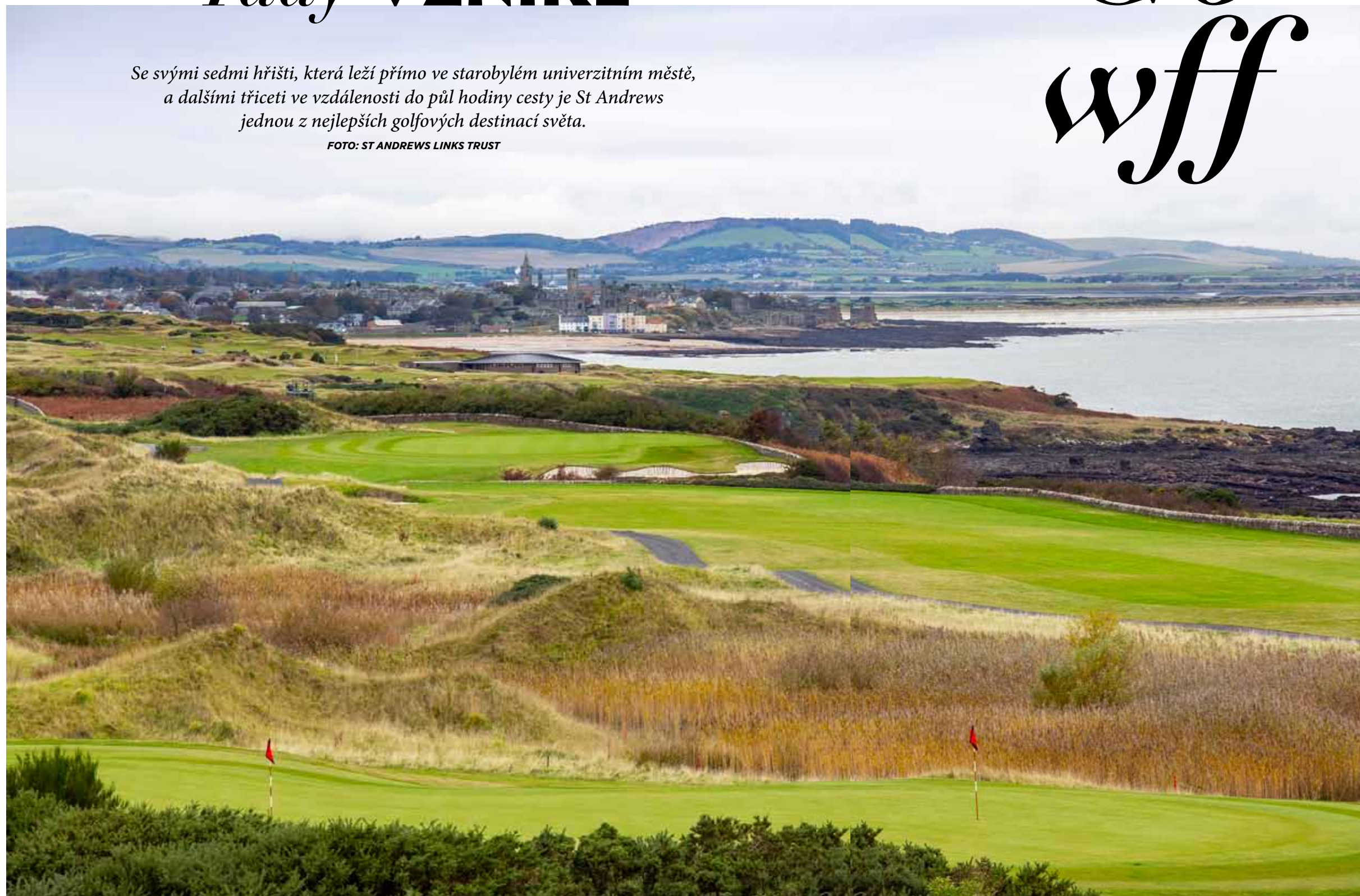
Hřiště Kittocks z Fairmont St Andrews