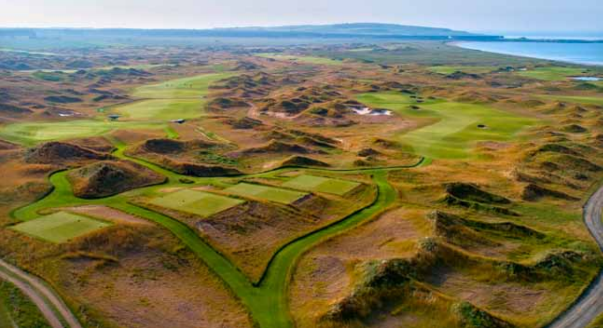
Dumbarnie: jamka číslo 3