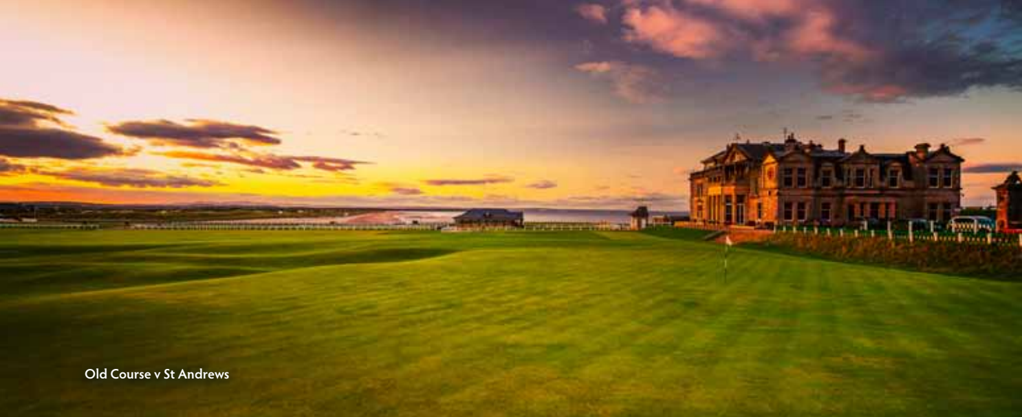
Old Course v St Andrews