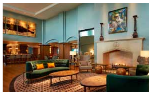
Lobby hotelu Fairmont